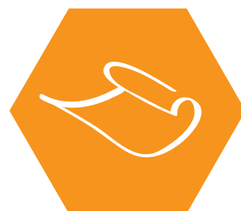
serviettes en papier mouchoirs et essuie-tout (sans produits chimiques)