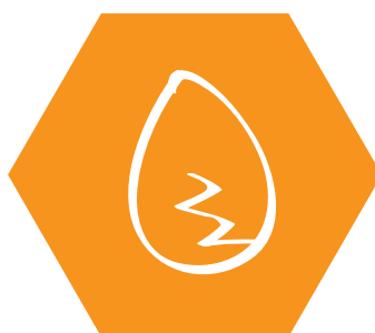
coquilles d'œuf et de fruits secs