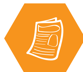
papier journal ayant servi à l'épluchage