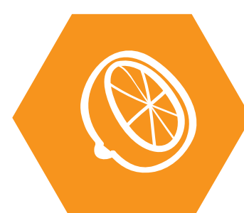
agrumes à découper en petits morceaux