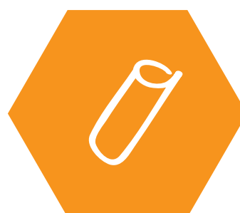
rouleaux de papier toilette et de papier essuie-tout