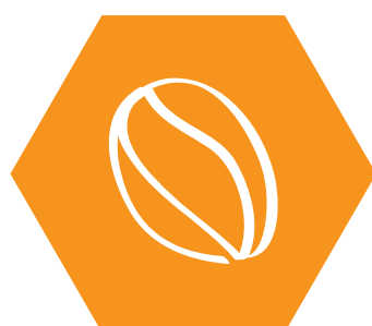
marc et filtres à café