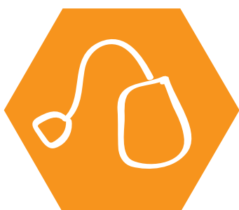
thé en sachet ou en vrac